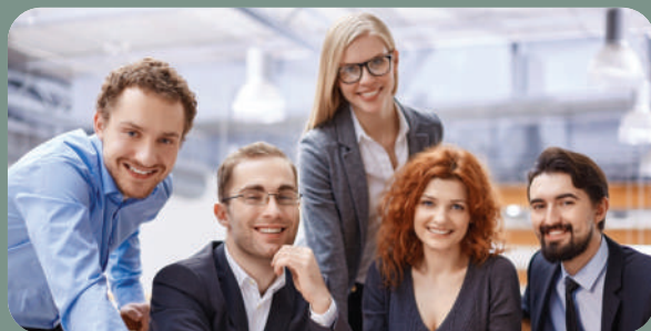
KOMPANIJSKE SPA KARTE

Za više informacija o pogodnostima koje pružamo za lojalne korisnike raspitajte se na spa recepciji.