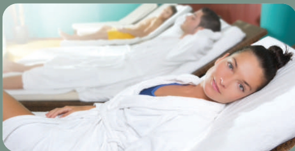
DNEVNE, NEDELJNE, MESEČNE, POLUGODIŠNJE I GODIŠNJE SPA KARTE